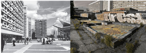
Das PARTEIvakuum der 90er hat immense Spuren auf der Stadtpromenade hinterlassen

Zur Location (=Prima Wetter) 1938 als Sport- u. Feierhalle der ehemaligen Hochschule für Lehrerbildung als Max-Mommsen-Halle errichtet, 1954 umgebaut; danach als Haus der Offiziere und ab 1959 als Haus der Nationalen Volksarmee genutzt; 1986 entstellende Umbauten. Charakteristisches Gebäude der Architektur des Dritten Reiches. Ab 90er: Clubkassino, Unilehrgebäude & Freiraum für StudentInnen, Leerstand. Für dieses Wochenende aufgehübscht, aber trotzdem brüchig und ohne WLAN. Ansonsten Spekulationsobjekt.